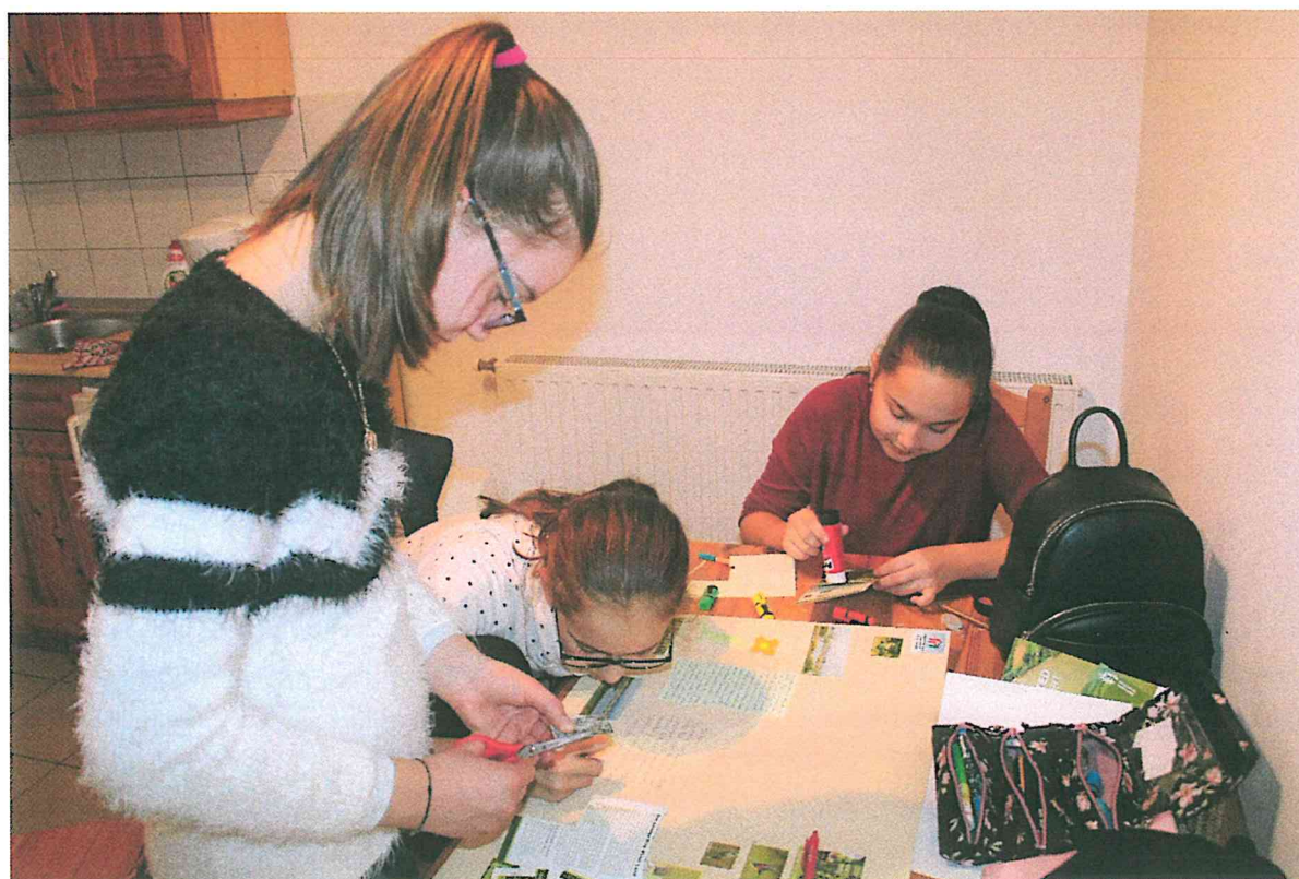
Hegykő — projektfeladatok elkészítése