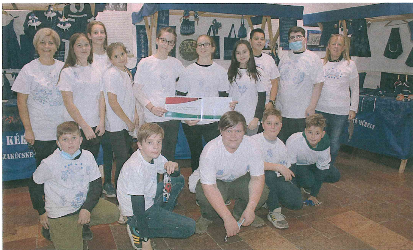
2020.10.22. Pápa — A Kékfestő Műhely rejtelseibe való betekintés, saját póló festése