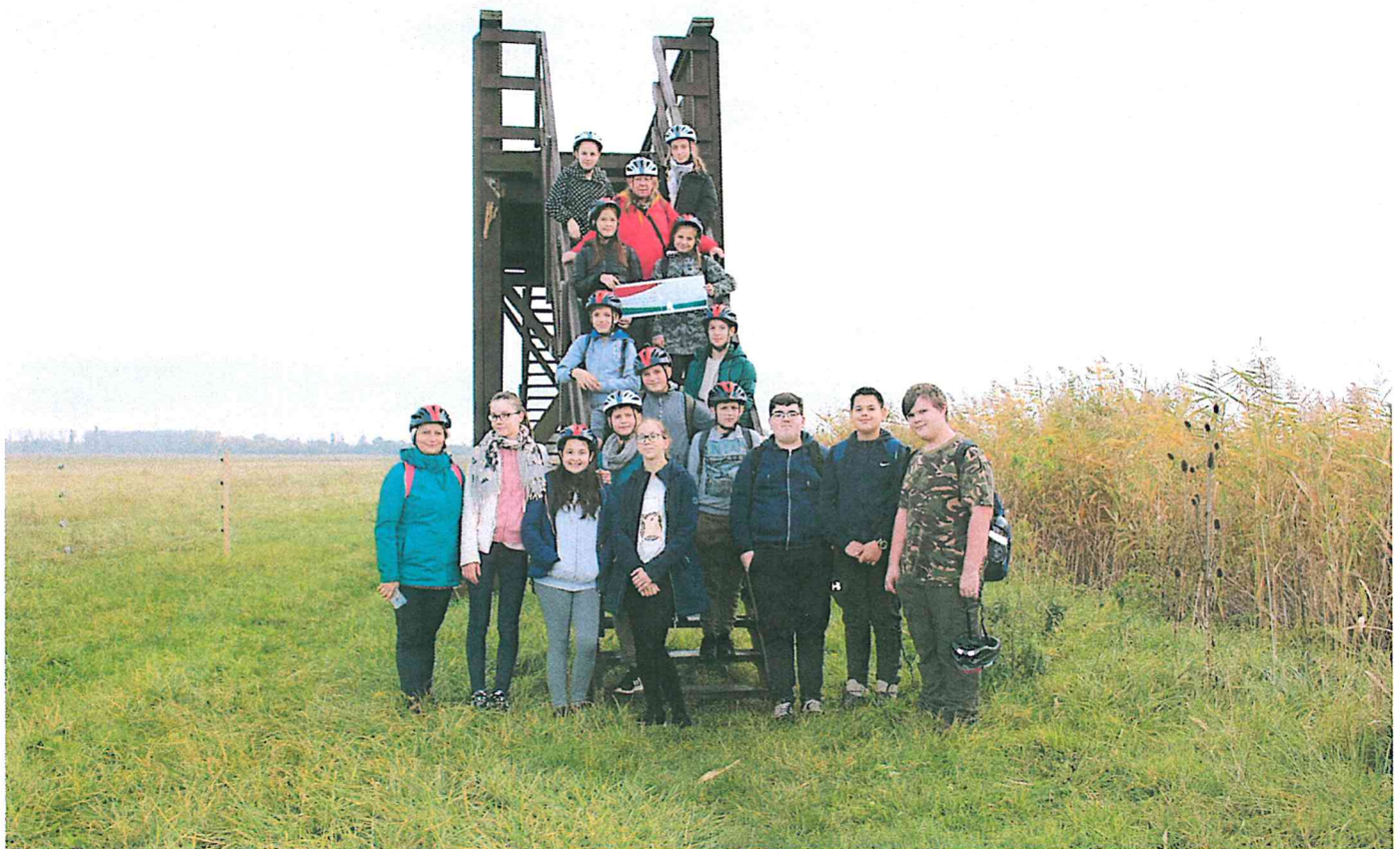
2020.10.24. Fertő-Hansági N.P. Lászlómajor Látogatóközpont megtekintése és kerékpártúra