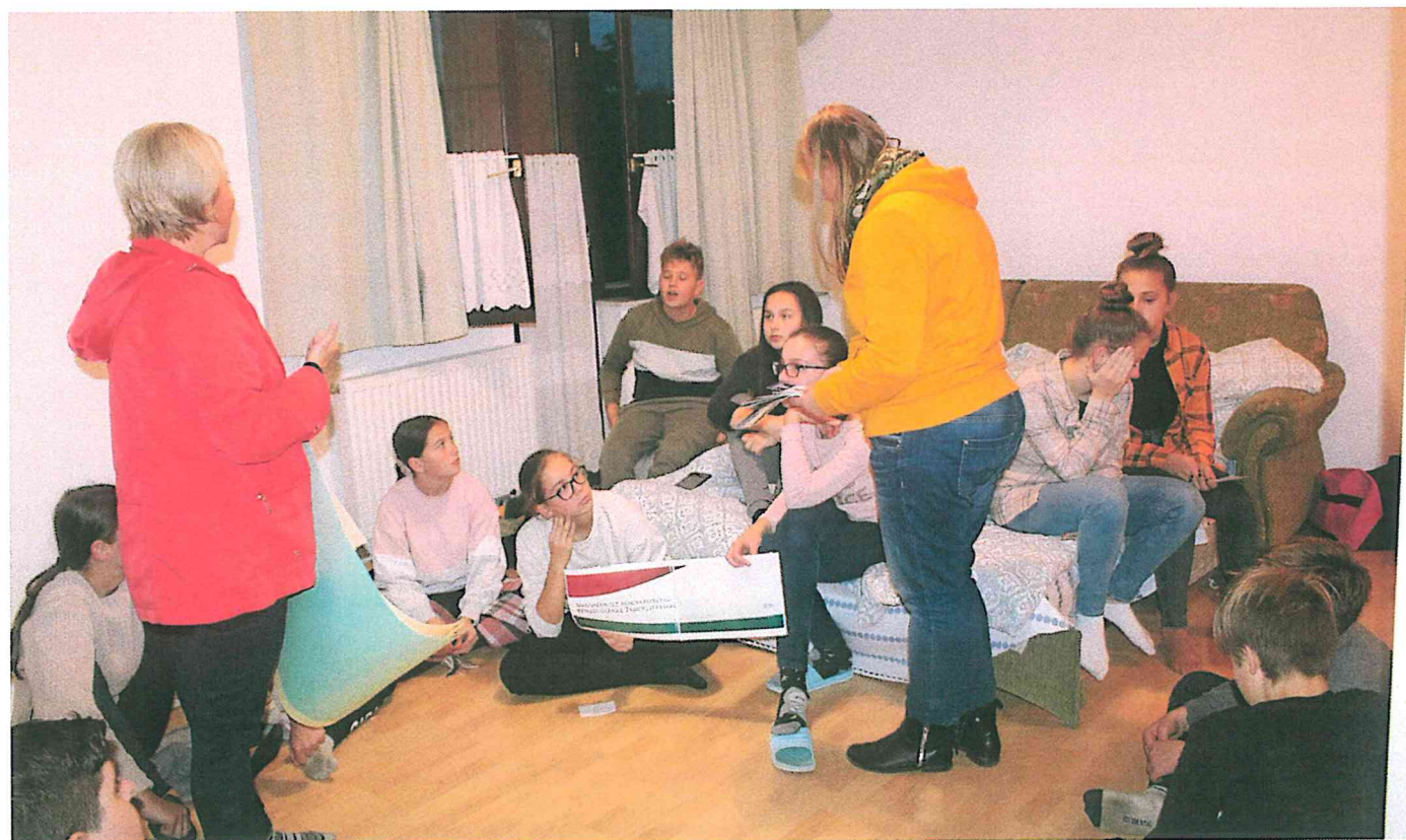
2020.10.23. Hegykő — projektmegbeszélés