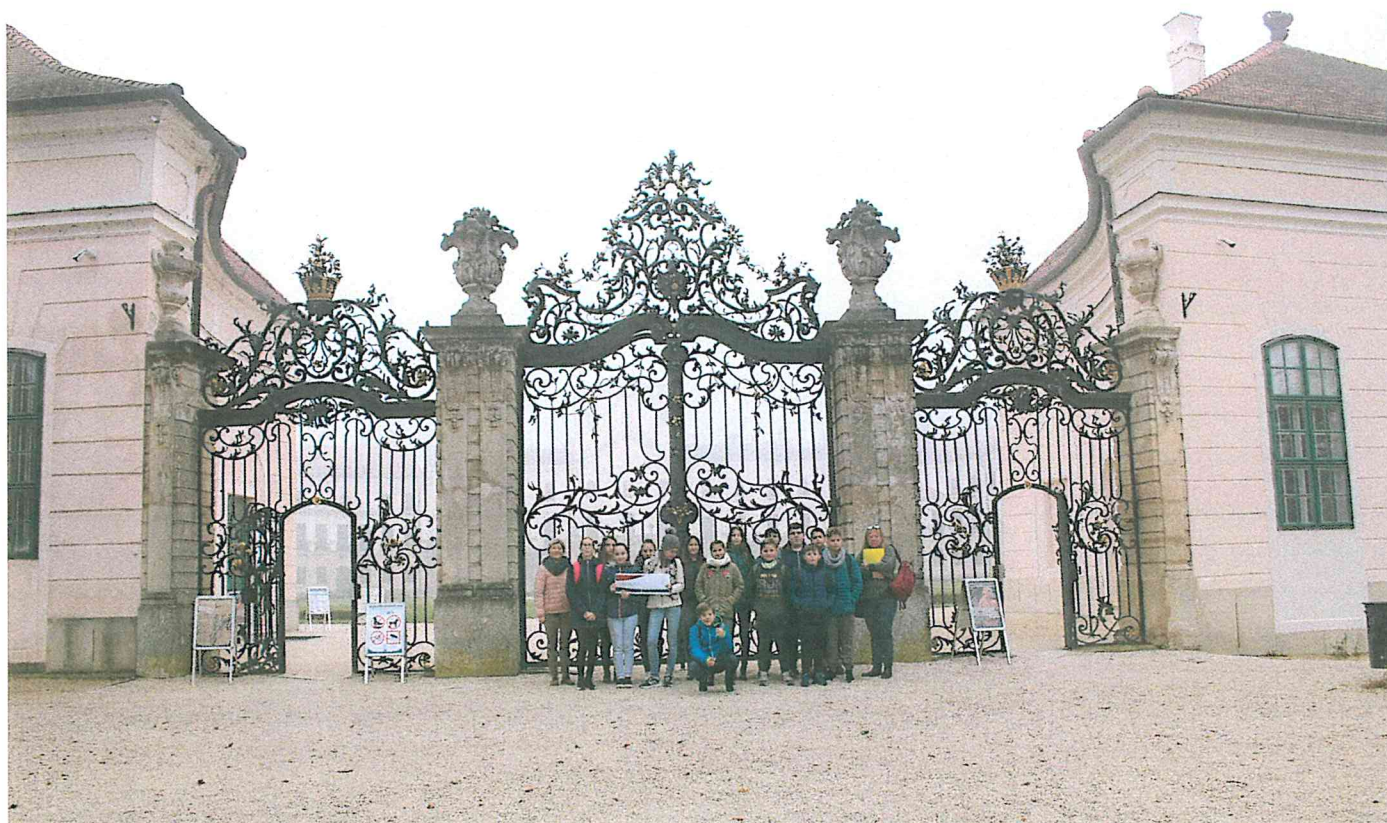
2020.10.23. Fertőd — Esterházy-kastély