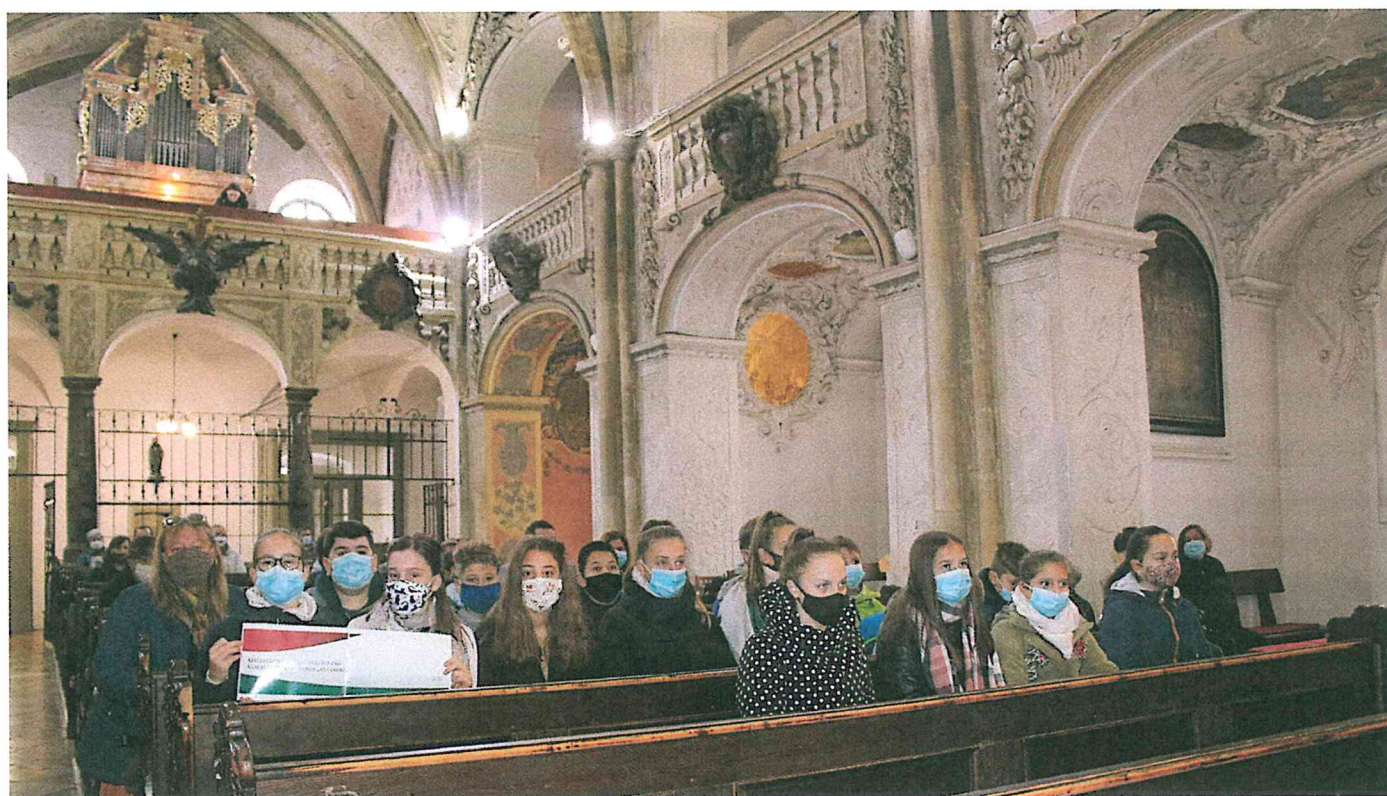
2020.10.25. Sopron — Szent György Templom