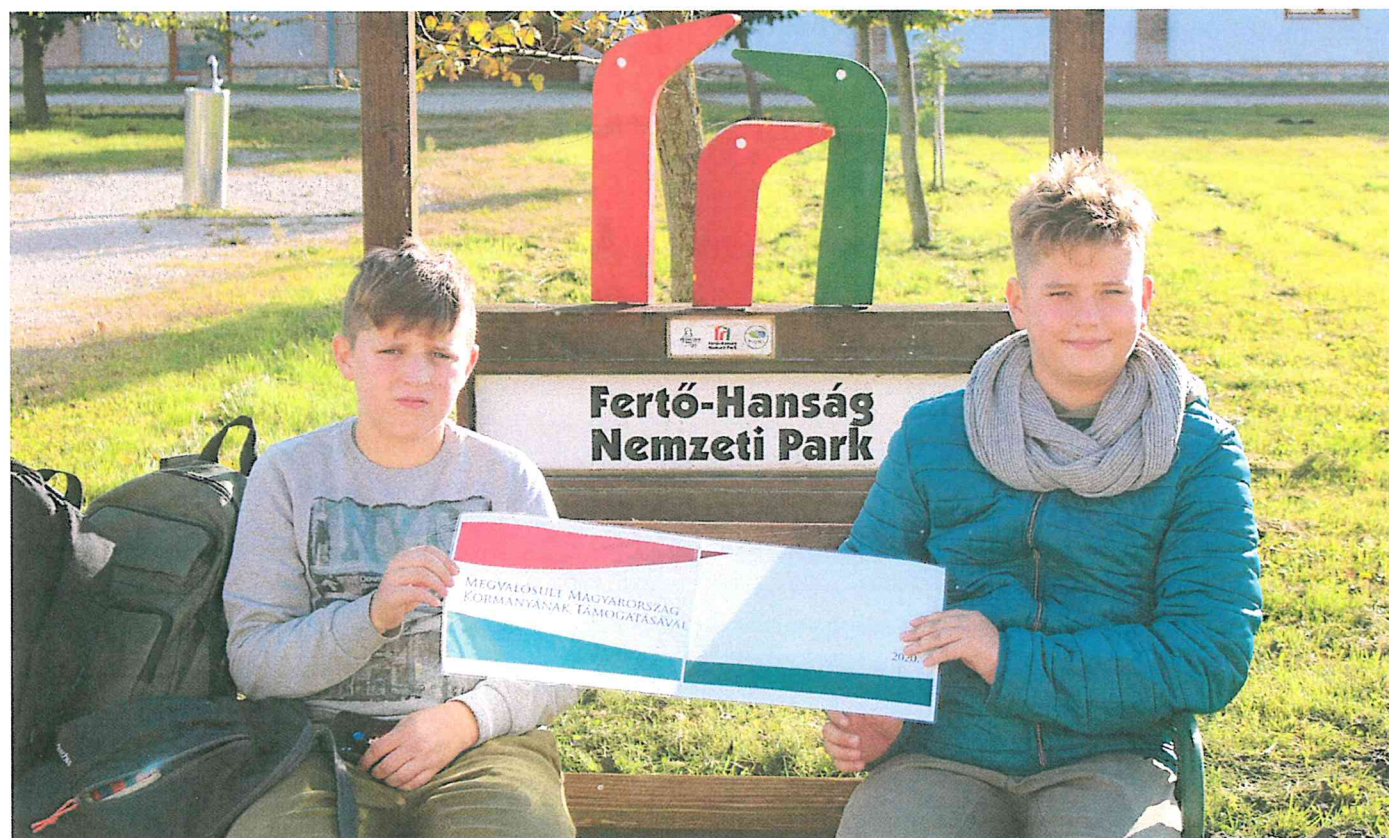
2020.10.24. Fertő-Hansági N.P. Lászlómajor Látogatóközpont megtekintése és kerékpártúra