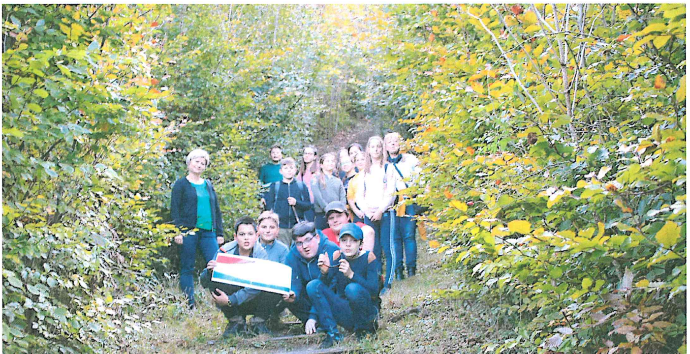
2020.10.22. Bánd — Őszi erdei túra a „Tiszafás tanösvény”-en