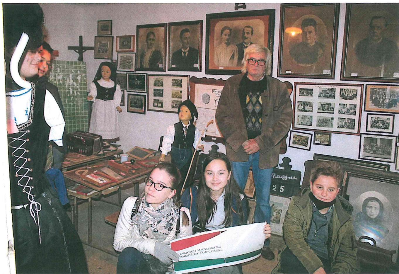
2020.10.24. Agendorf — Német nemzetiségi tájház