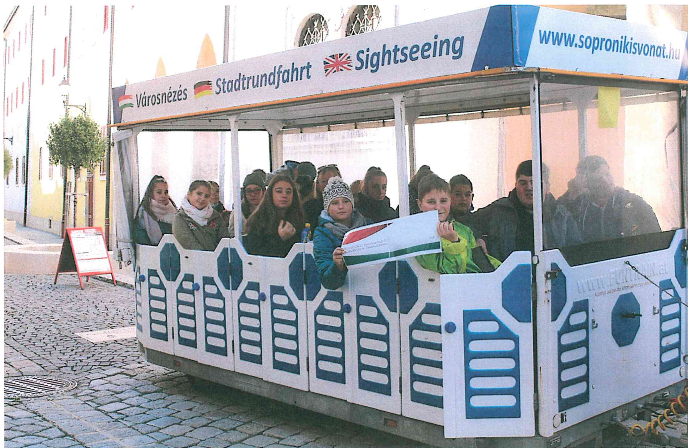
2020.10.25. Sopron — városnézés kisvonattal