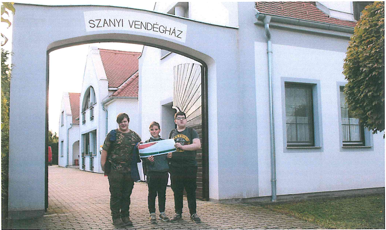
2020.10.22. Hegykő — Szanyi Vendégház szálláshely elfoglalása