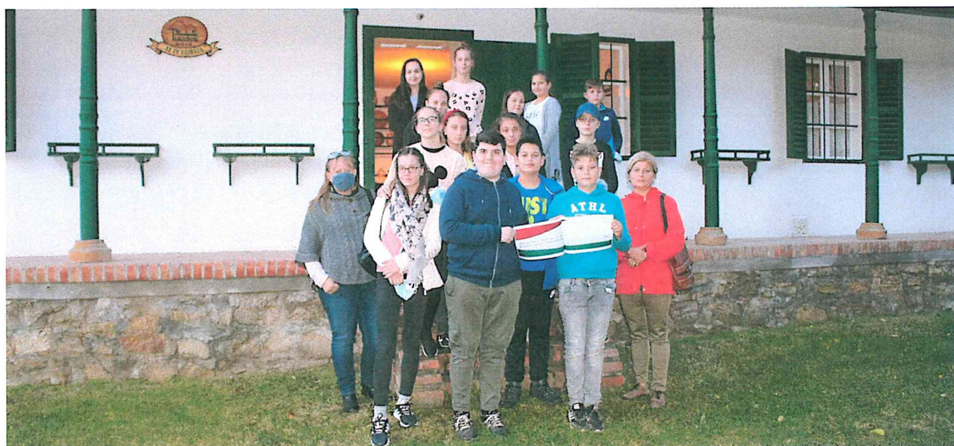
2020.10.26. Nagymányok — német nemzetiségi tájház