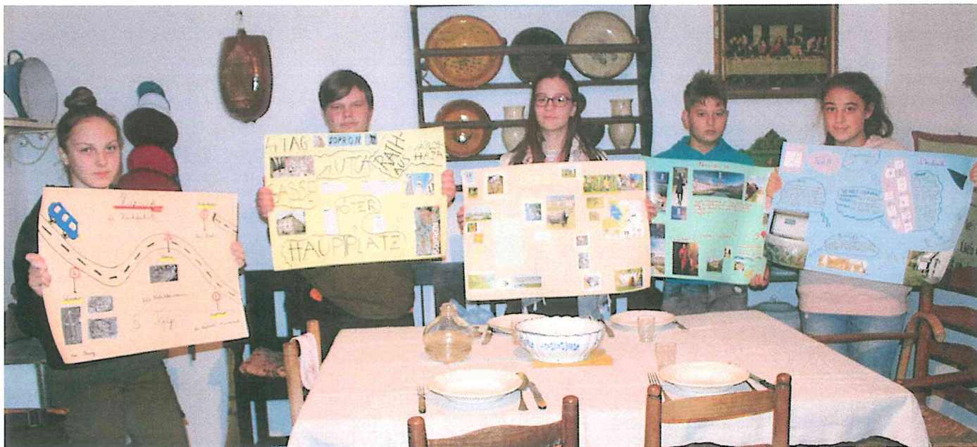
2020.10.26. Nagymányok — projekt délután kiértékelése