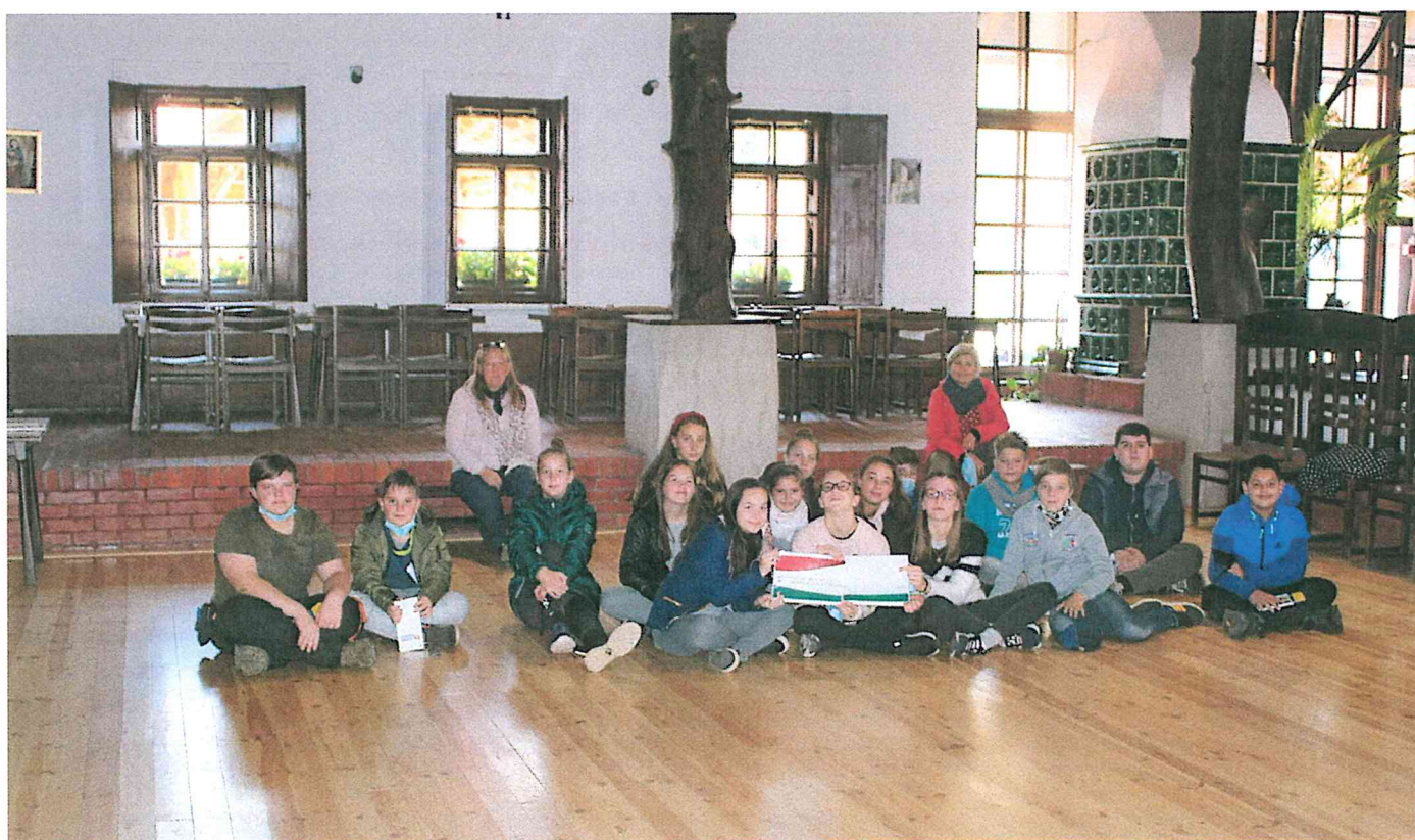
2020.10.26. Zalaszentlászló - a Makovecz faluház, mint a magyar organikus építészet példája