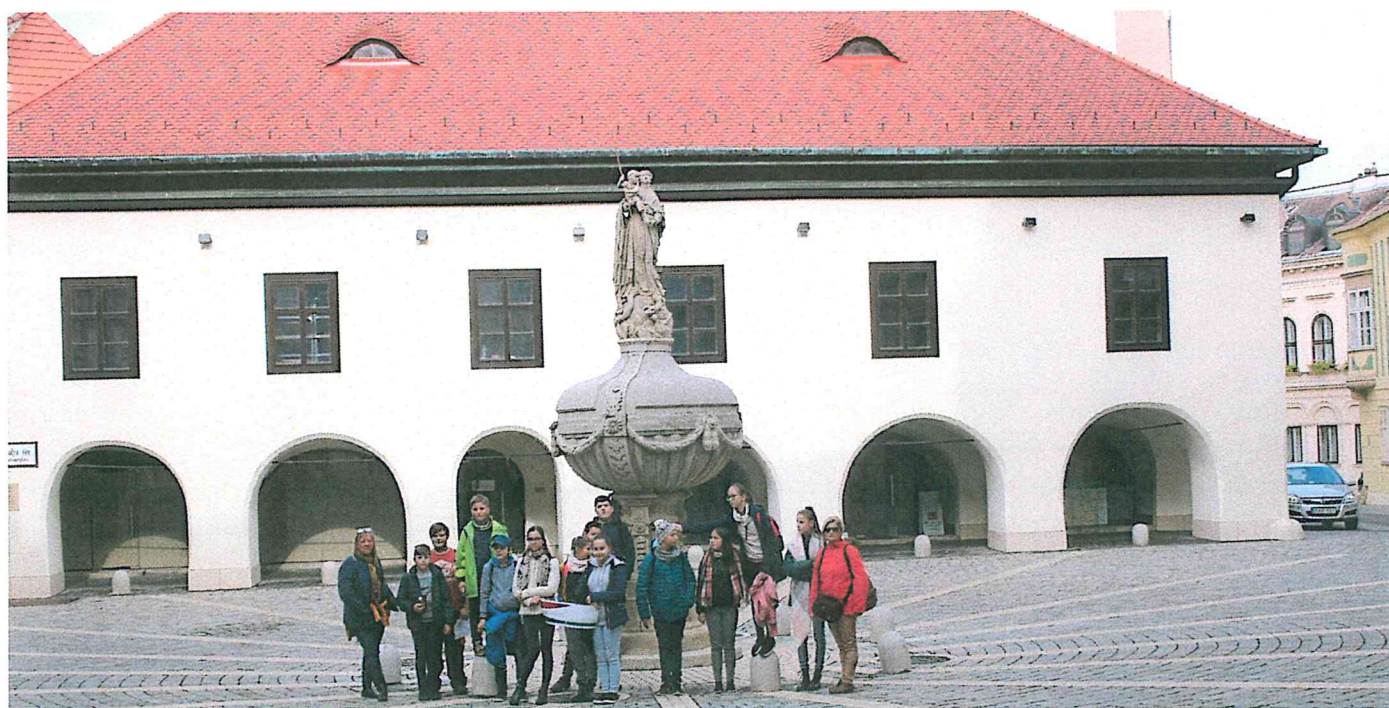
2020.10.25. Sopron — városnézés, múzeumlátogatás