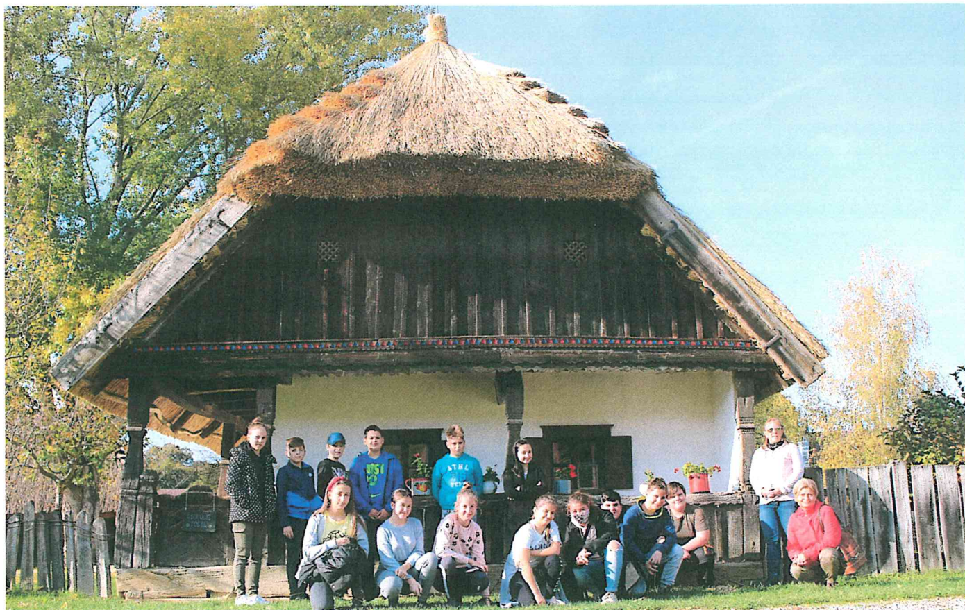
2020.10.26. Szenna — skanzen falu