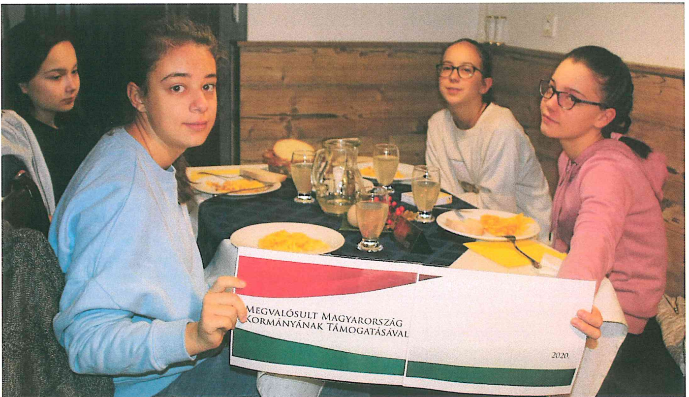
2020.10.23. Fertőhomok — Szent Anna Fogadóban reggeli 4/16